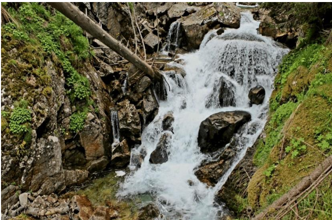
Водопад Јуленски скок

07:00. Долазак у Банско и пауза за доручак. Одлазак минибусом до локалитета Хајдучка пољана, повише Банског и полазак на пешачку туру: Хајдучка пољана 1500 - водопад Јуленски скок 1600 – планинарски дом Демјаница 1895. Пешачићемо око 5 сати. Смештај је у дому Демјаница, собе су вишекреветне са постељином, а дом има етажно купатило као и кантину.